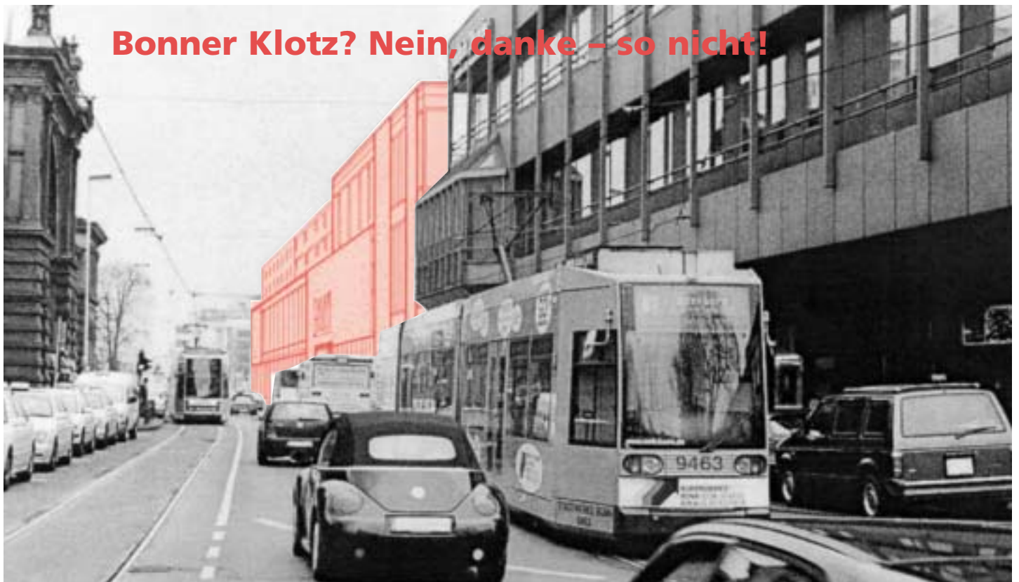
Angenäherte, skizzierte Darstellung.

Für ein erfolgreiches Bürgerbegehren brauchen wir Ihre und weitere ca. 9000 Unterschriften. Reichen die Unterschriften, muss der Rat entweder dem Bürgerbegehren folgen, oder es kommt zu einem Bürgerentscheid, bei dem alle Bonner Bürgerinnen und Bürger in einer Wahl über das Bürgerbegehren abstimmen dürfen. Bitte sprechen Sie Ihre Freunde und Bekannten an, fragen Sie Ihre Nachbarn, ob sie bereits eine Unterschriftenliste haben, wenn nicht, seien Sie bitte so freundlich und verteilen Sie Unterschriftenlisten – auch bei Geschäftsleuten, bei denen Sie Kunde sind.